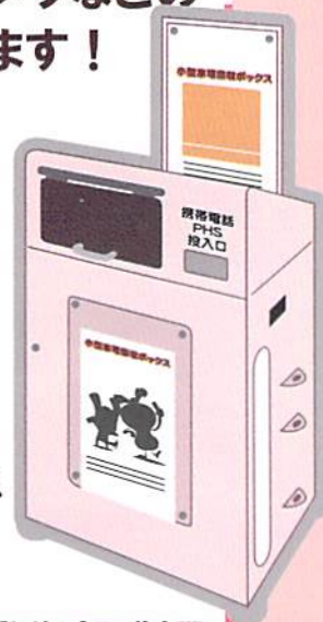
回収ボックス (イメージ)

回収ボックス設置場所や、イベントの情報等は市の広報及びホームページ等に掲載します。