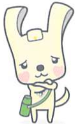
ヨコハマ 3R 夢! マスコット イーオ

ごみの分別を子供に教えたいけど、 何だか難しそう。楽しく分別が学べる アプリってないのかな?