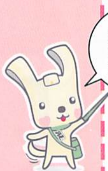
スリム ヨコハマ 3R 夢! マスコット イーオ