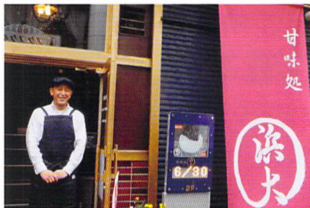
和風甘味・食事処「浜大(はまだい)」は6月30日にオープン (公式ツイッター: https://twitter.com/hamadai1942 )