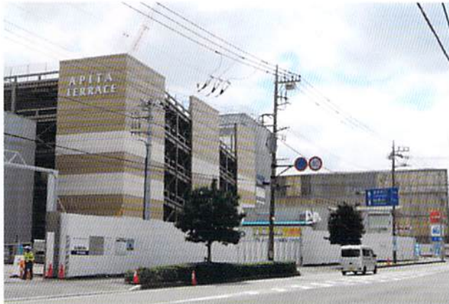
建設が進む「アピタテラス」(左)、右奥は米アップルの研究所「YTC」

「アピタ」が来年春に戻ってきます。パナソニック(旧松下通信工業)跡地の「網島SST(Tsunashimaサスティナブル・