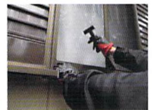
窓を割られて侵入されるケースが多い(写真はイメージ)

網島西と下田町を中心としたエリアで空き巣被害が相次いでいます。網島西と網島台では今年に入り公開されただけで未遂含め13件、下田町では1～3丁目8月下旬から5件が連続。一戸建て・集合住宅ともに狙われており十分な警戒が必要です。