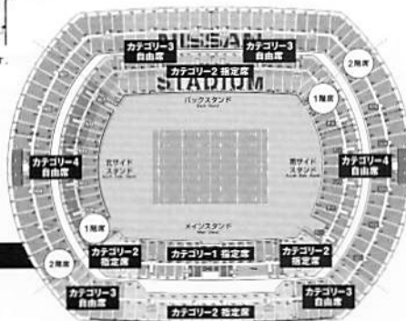
リポビタンDチャレンジカップ2017 日本代表 VS オーストラリア代表 日産スタジアム(神奈川)