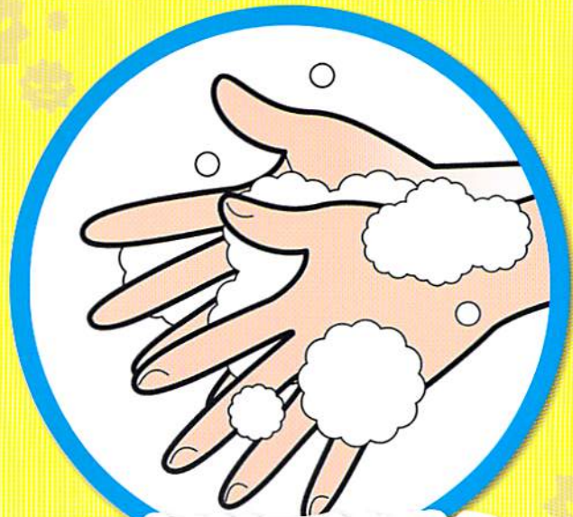
こまめに手を洗う

帰宅時や調理の前後、食事前などにせっけんを使って洗いましょう。アルコール消毒も有効です。