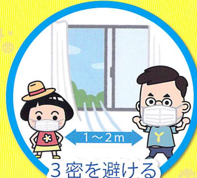
3密を避ける ※家庭内でも

外出時や屋内でも会話するときは、可能な限り真正面を避け、人との間隔がとれない場合は、症状がなくてもマスクをつけましょう。