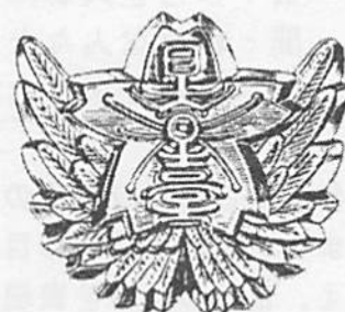
日吉台小学校 校章