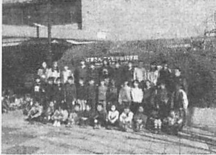
▲はまぎんこども宇宙科学館にて

4年生は、校外学習へ出かけました。コロナ禍でしたが、2つの施設とも本校のみの貸切で実施できました。はまぎんこども宇宙科学館では、科学に関する様々なアトラクションを楽しんだり、プラネタリウムを鑑賞したりしました。また、横浜市防災センターでは、各種体験を通して防災意識を高めました。