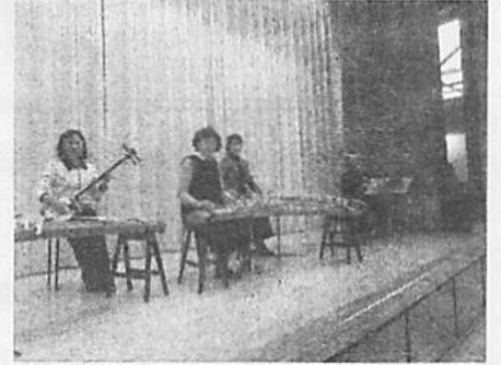
▲ソーシャルディスタンスを保って

12月2日、体育館において、箏や尺八、三味線などの和楽器を港北三曲会の方々が演奏してくださいました。初めて見る楽器や音色に6年生はみんな興味津々でした。日本独特のメロディー、曲の雰囲気を感じながらたっぷり1時間、姿勢正しく真剣に聞き入る6年生の姿がとても印象的でした。日本の伝統文化に触れるよい機会となりました。港北三曲会の皆様、すばらしい演奏をありがとうございました。