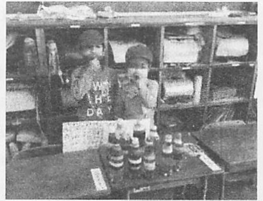
▲「いらっしゃいませ！」

生活科の学習「あきとなかよし」では、6年生と公園へドングリを拾いに行ったり、グループで話し合いをしたりして、あきまつりの準備を進めてきました。お客さんとして招待する予定だった6年生を招待できなくなってしまい残念な部分もありましたが、本番は1年生同士でお店開きをしました。季節は、秋から冬の装いですが、秋の出来事を振り返りながら、12/11、いよいよ秋祭りの始まりです。「お客さんがたのしめる あきまつりにしよう。」をめあてに、「いらっしゃいませ～」とお客さんに声を掛けたり、遊び方の説明をしたりして、お客さんを意識して楽しく活動しました。コミュニケーションを楽しみながらたっぷり遊びました。