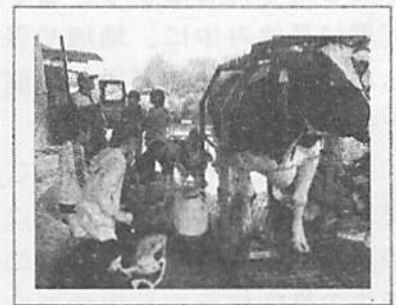
▲命の大切さを学んだ 酪農体験