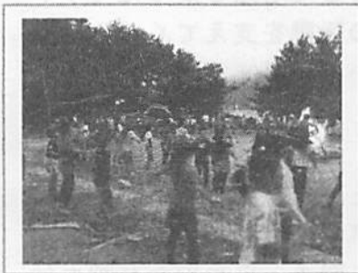
▲盛り上がった キャンプファイヤー

充実した二日間を過ごし、西湖で「サイコー」の思い出をつくることができました。二日間を通して学んだことを学校生活でも生かしていきます。